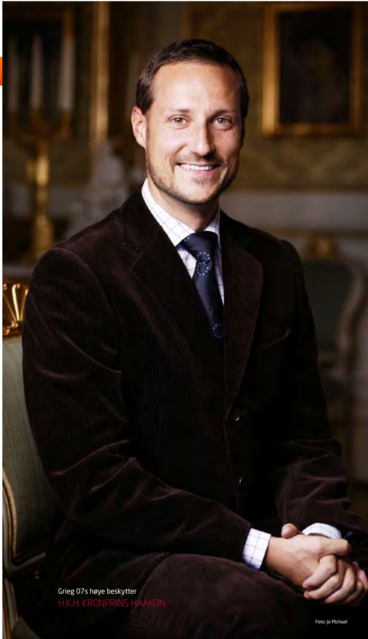
Grieg 07s høye beskytter H.K.H. KRONPRINS HAAKON