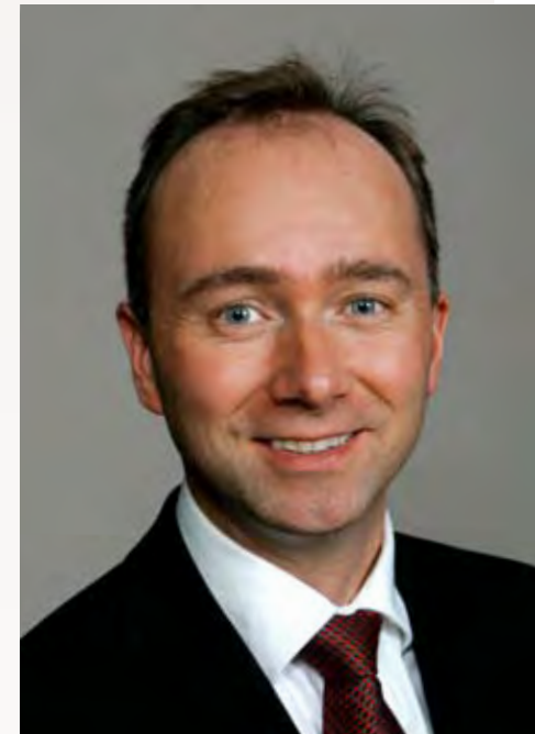
TROND GISKE KULTUR- OG KIRKEMINISTER